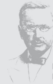
Friedrich-Wilhelm Raiffeisen | ENERGIE eG