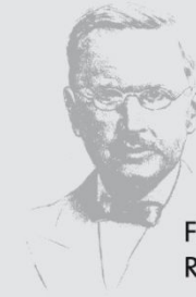
Friedrich-Wilhelm Raiffeisen | ENERGIE eG