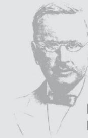
Friedrich-Wilhelm Raiffeisen | ENERGIE eG

Die vom Genossenschaftsverband Bayern e.V. durchgeführte Prüfung der wirtschaftlichen Verhältnisse erfolgte auf der Grundlage einer kritischen Würdigung des von dem Steuerberater erstellten Jahresabschlusses zum 31.12.2015 auf Plausibilität.